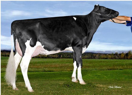
PROVETAZ OVERTIME CAMILA